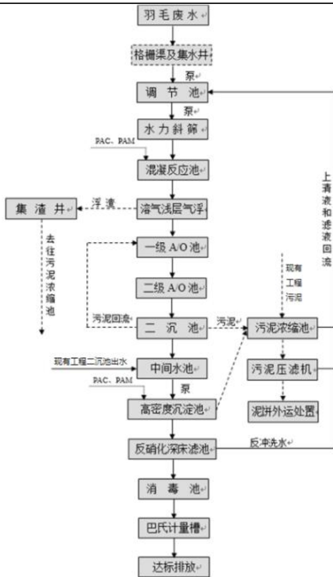
图 4-2 污水处理厂工艺流程图